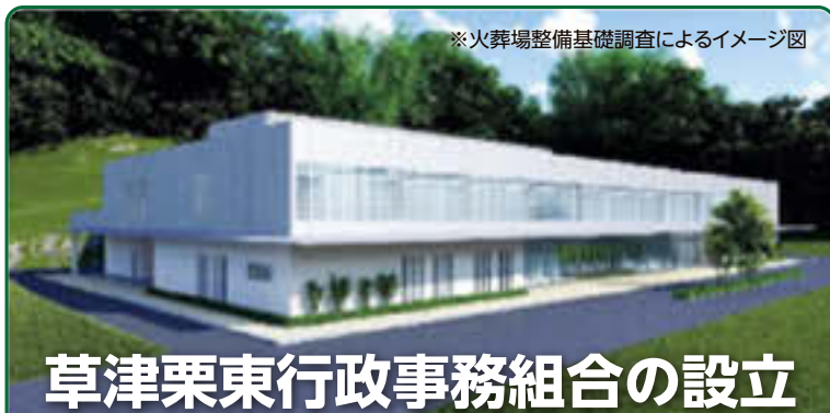
※火葬場整備基礎調査によるイメージ図